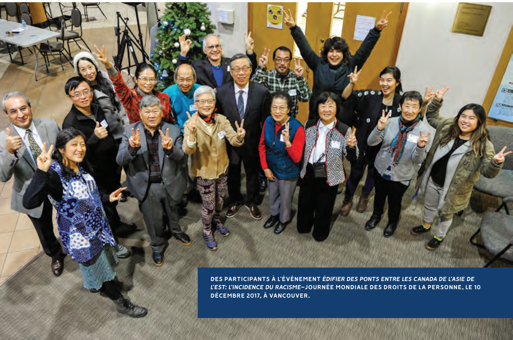
DES PARTICIPANTS À L'ÉVÈNEMENT ÉDIFIER DES PONTS ENTRE LES CANADA DE L'ASIE DE L'EST: L'INCIDENCE DU RACISME—JOURNÉE MONDIALE DES DROITS DE LA PERSONNE, LE 10 DÉCEMBRE 2017, À VANCOUVER.